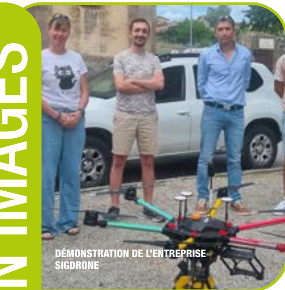
DÉMONSTRATION DE L'ENTREPRISE SIGDRONE