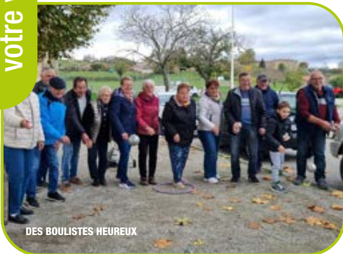
DES BOULISTES HEUREUX