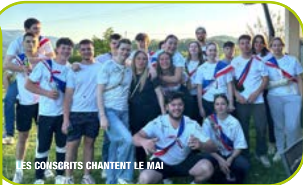
LES CONSCRITS CHANTENT LE MAI