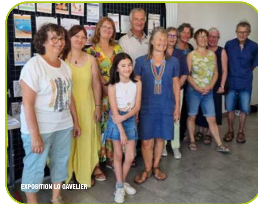
EXPOSITION LO GAVELIER