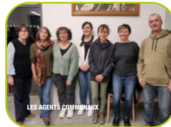
LES AGENTS COMMUNAUX