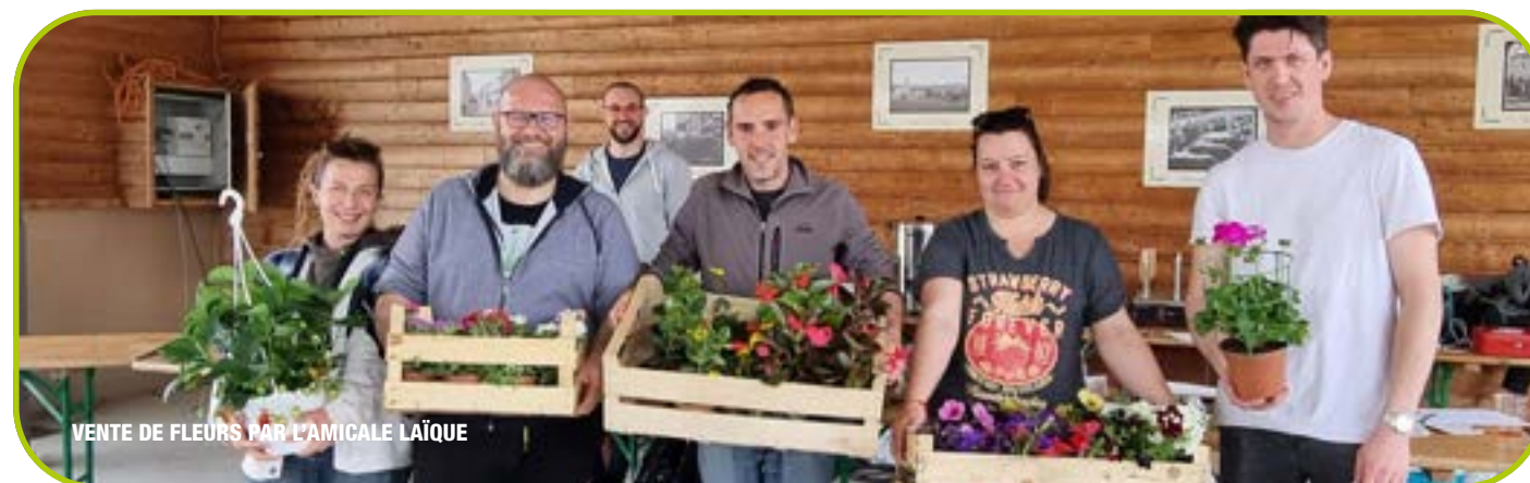
VENTE DE FLEURS PAR L'AMICALE LAÏQUE