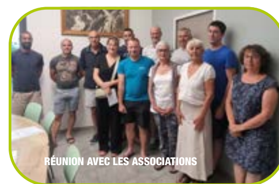
RÉUNION AVEC LES ASSOCIATIONS