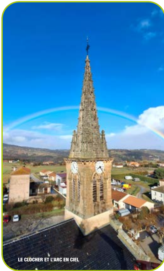
LE CLOCHER ET L'ARC EN CIEL