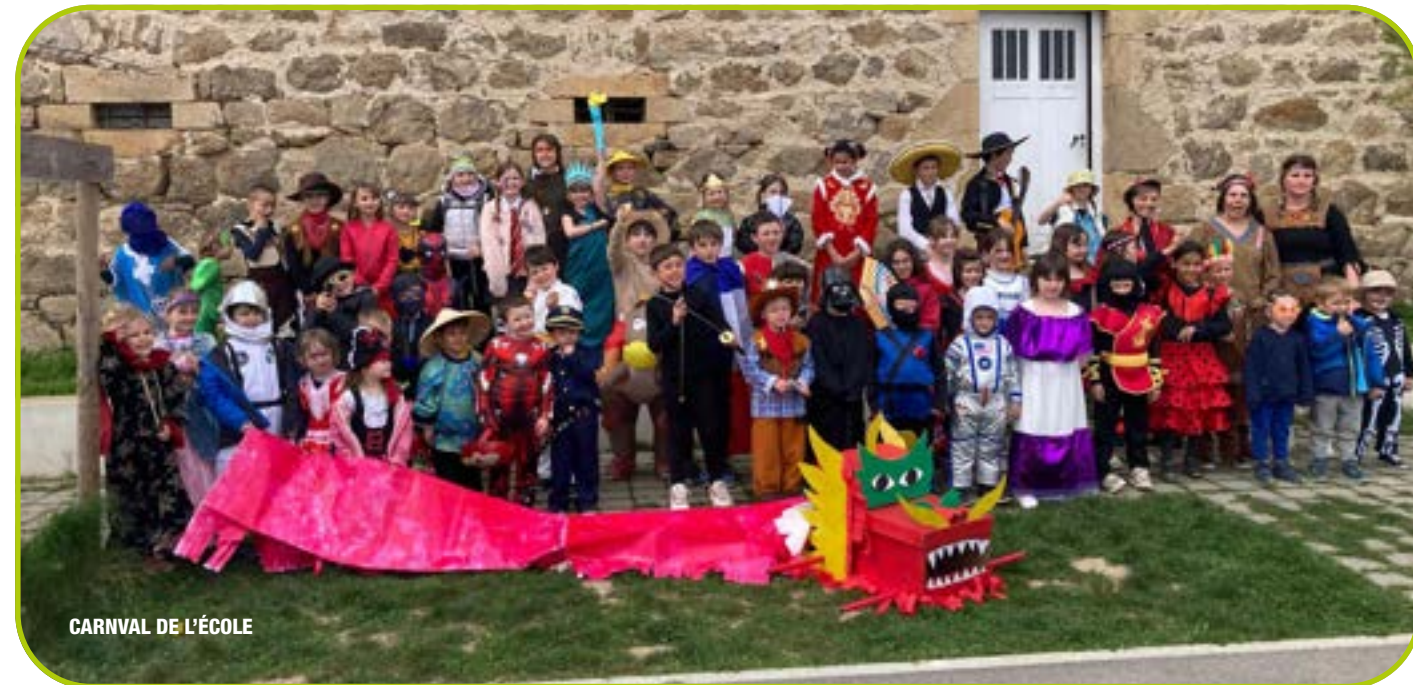
CARNVAL DE L'ÉCOLE