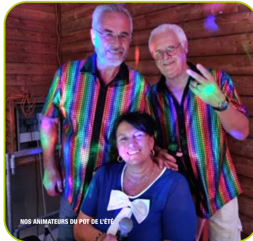
NOS ANIMATEURS DU POT DE L'ÉTÉ