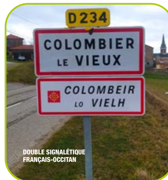
DOUBLE SIGNALÉTIQUE FRANÇAIS-OCCITAN