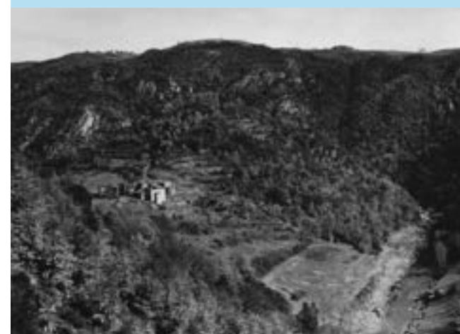
Prise par Didier Roux avant de donner son accord pour se lancer dans l'aventure, c'est l'unique photo prise sous cet angle avant travaux !

Les Suisses de Saint-Sorny ont célébré leurs 60 ans de présence dans la région ardéchoise.