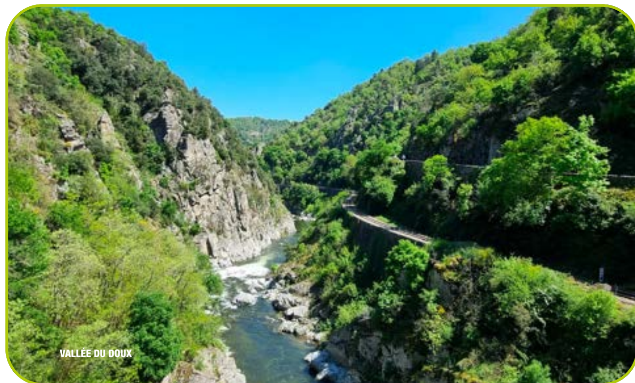
VALLÉE DU DOUX