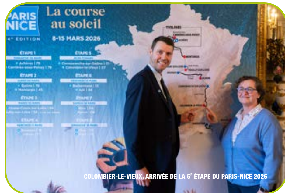
COLOMBIER-LE-VIEUX, ARRIVÉE DE LA 5 e ÉTAPE DU PARIS-NICE 2026