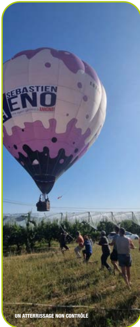
UN ATERRISSAGE NON CONTRÔLÉ