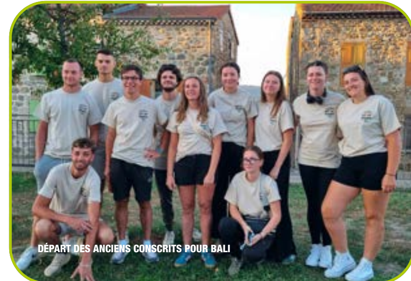
DÉPART DES ANCIENS CONSCRITS POUR BALI