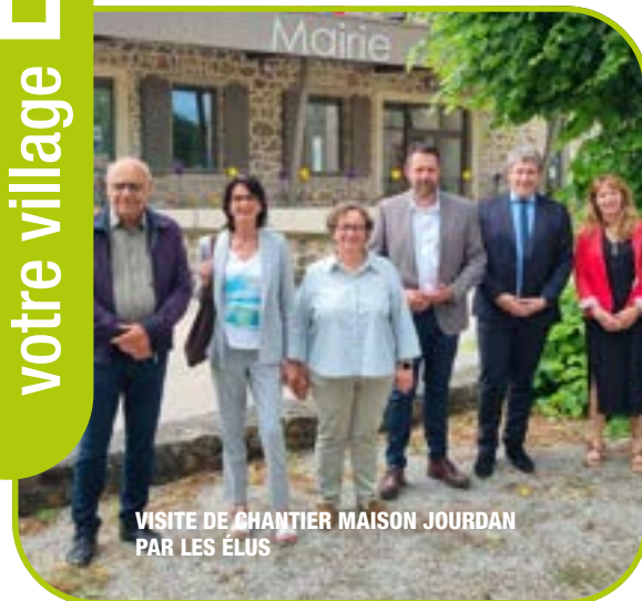
VISITE DE CHANTIER MAISON JOURDAN PAR LES ÉLUS