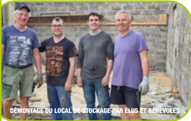
DÉMONTAGE DU LOCAL DE STOCKAGE PAR ÉLUS ET BÉNÉVOLES