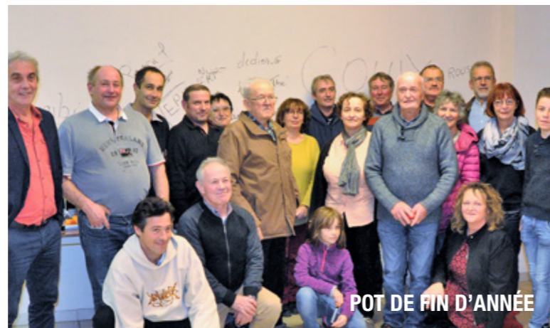
POT DE FIN D'ANNÉE