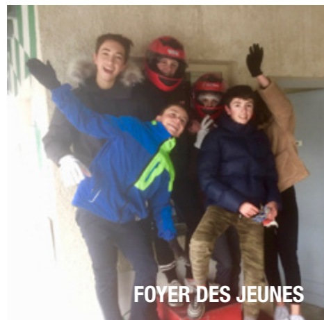
FOYER DES JEUNES