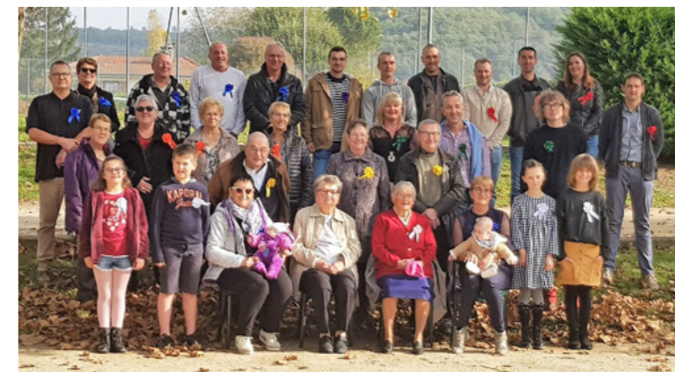
CLASSE EN 8