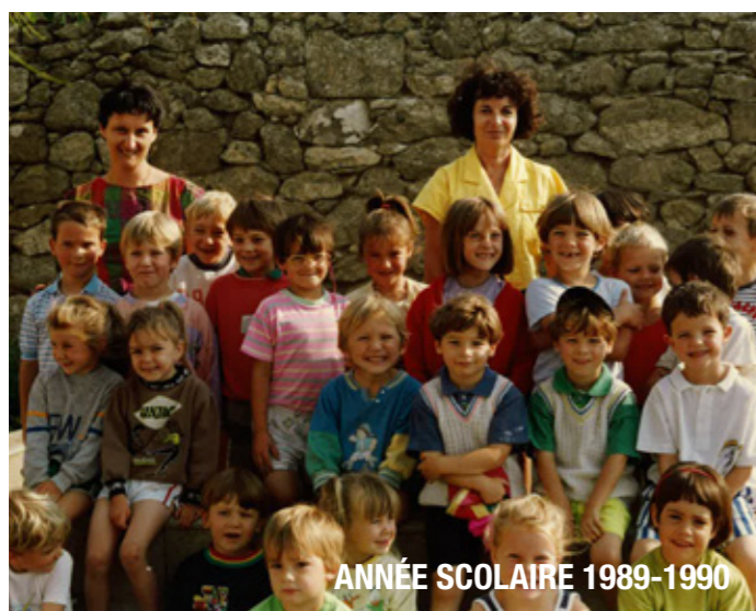
ANNÉE SCOLAIRE 1989-1990