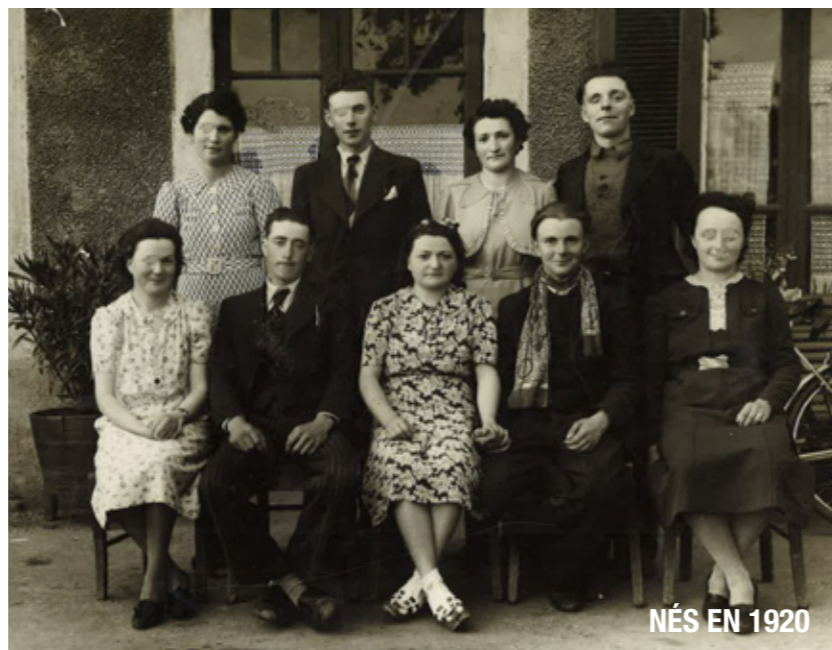
NÉS EN 1920