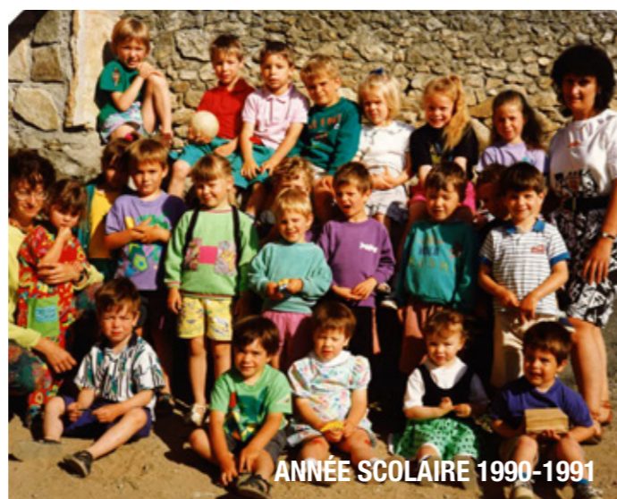
ANNÉE SCOLAIRE 1990-1991