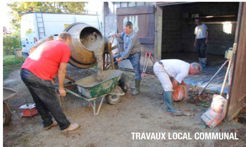
TRAVAUX LOCAL COMMUNAL