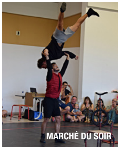
MARCHÉ DU SOIR