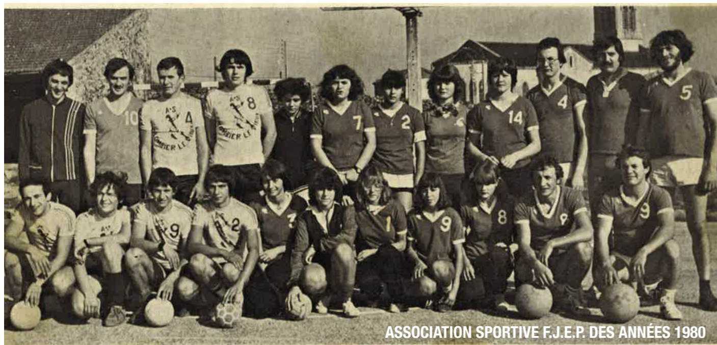
ASSOCIATION SPORTIVE F.J.E.P. DES ANNÉES 1980