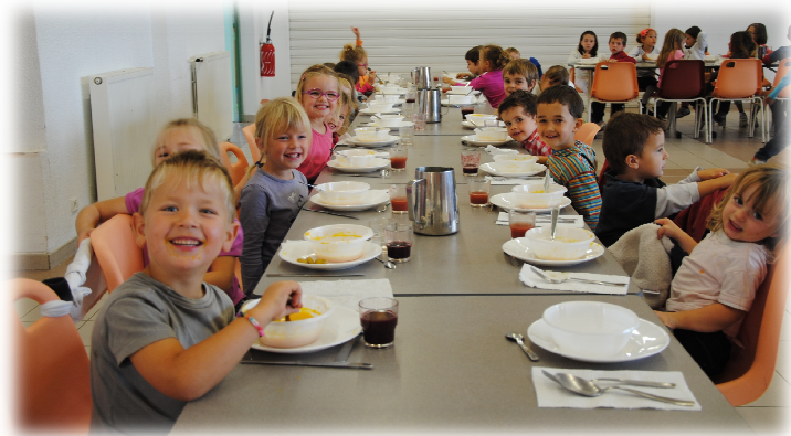
Repas du goût

VOUS ETES TOUS INVITES AUX VŒUX DE LA MUNICIPALITE, SAMEDI 17 JANVIER A 15H