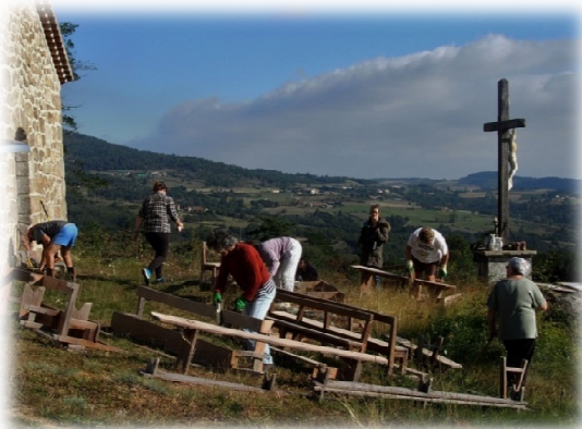
Journée citoyenne : La chapelle, et La Salette