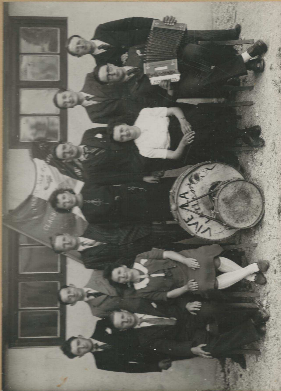
COLOMBIER-LE-VIEUX, 28 Mai 1944