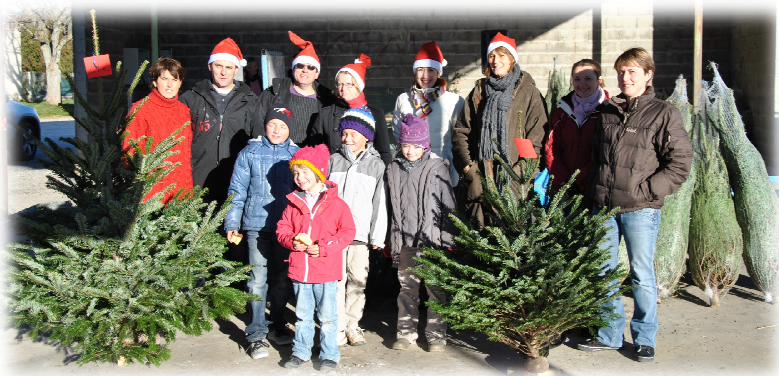
Vente de sapins par l'école